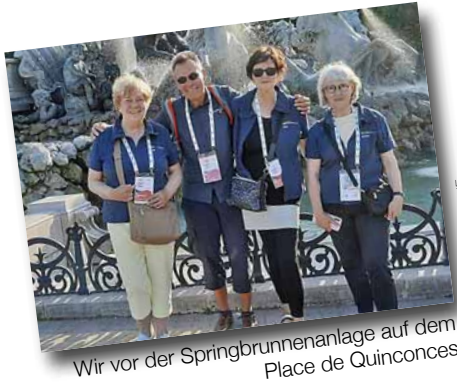
Wir vor der Springbrunnenanlage auf dem Place de Quinconces