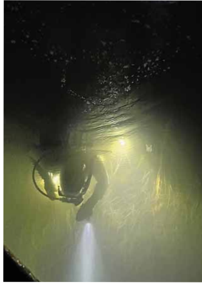
Links: Kai, oben: Dieter

sen wunderbar fotografiert wurde (er ist selbst Taucher), sahen wir erst am Folgetag zur Abreise.