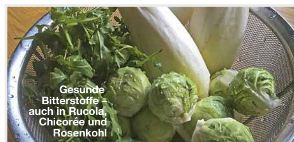
Gesunde Bitterstoffe – auch in Rucola, Chicorée und Rosenkohl