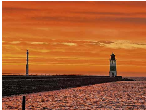
Traumhafte Abendstimmung am Leuchtturm