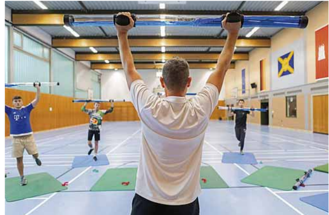
Motiviert und konzentriert – Lufthansa-Azubis beim Gesundheitsseminar