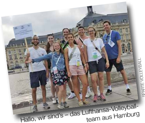
Hallo, wir sind's – das Lufthansa-Volleyballteam aus Hamburg

„Super Erfahrung“ für die Sparte Volleyball