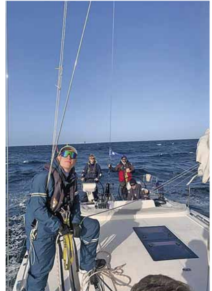
Oben alles klar?

schlafen und entspannt frühstücken zu dürfen. Gegen 12.00 Uhr hieß es dann „Leinen los“ und „Abschied nehmen“ von Travemünde, um das Boot wieder in Richtung Kieler Förde/Laboe zu steuern.