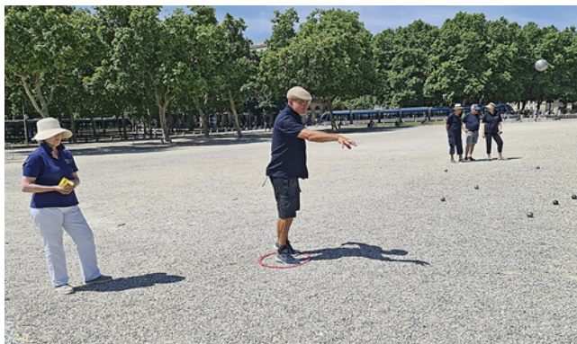
Oben: Warten auf die Tram Unten: fünf unserer Triplette-Spieler und eine „fliegende“ Kugel

Trams fügen sich übrigens ausgesprochen elegant in das Bild dieser wunderschönen UNESCO-Weltkulturerbe-Stadt Bordeaux ein. Es bringt Spaß, mit ihnen zu fahren! Wir waren schon am Sonntagabend in Bordeaux angekommen. Montag, Dienstag und Mittwoch hatten wir also genug Zeit, uns Bordeaux anzusehen. Natürlich wollten wir den