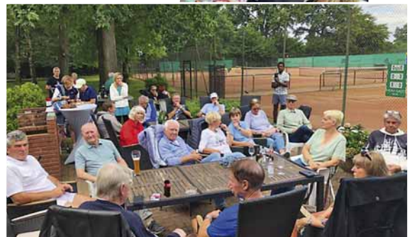
Nette Gespräche, leckeres Essen und viele bekannte Gesichter, die Tennis-Anlage war über den Tag gut besucht

Ab dem Tag danach regnet es wieder durchgehend weiter in Hamburg. Bis zum nächsten Mal Tschüß!