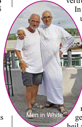
Men in White

sollte möglichst jeder in weißer Kleidung erscheinen. Die Brüder Rohloff in Weiß haben uns dort würdig vertreten.