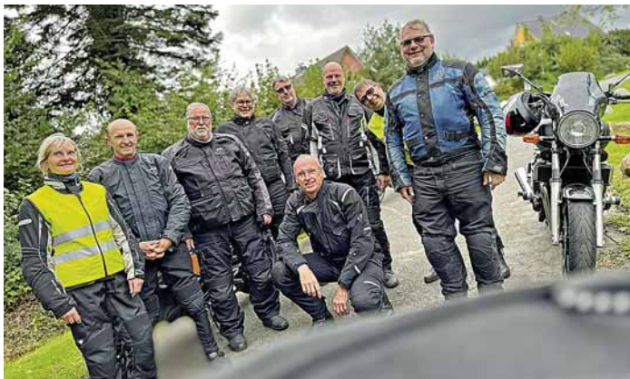
„Beweisfoto“ auf der traditionellen 3. Oktober-Tour in Brockstedt: Gruppenbild mit Motorrad

Nach leiblicher Stärkung und ausgiebigem ‚Klönchnack‘ wird die Fahrt