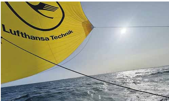
Das „große, gelbe Tuch“