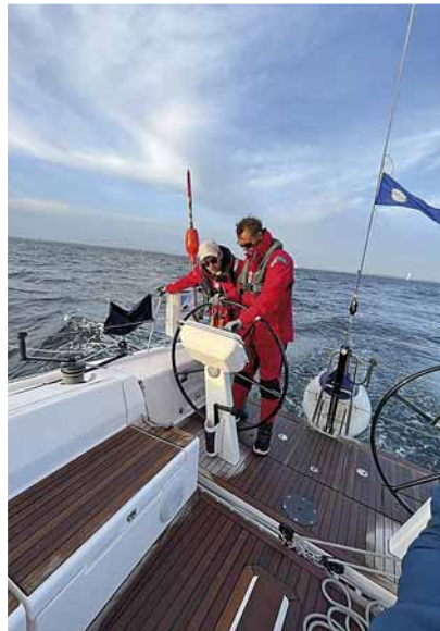
Was ist das denn, guck doch mal!

Winden mit etwa 20 Knoten und einem Gennaker. Nach einigen Stunden erreichte die Crew die Nord-Ost-Spitze von Fehmarn und musste dort schließlich das große, gelbe Tuch bergen. Von diesem Punkt an war „Feintrimm am Wind“ angesagt. Mit einem optimalen Windwinkel auf dem letzten Kurs zur Ziellinie konnte das Schiff seine wahre Stärke zeigen. Nach 10 Stunden und 3 Sekunden