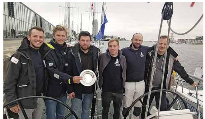
Die erfolgreiche Crew der X-Wings in der Baltic-Marina in Laboe

Durchfahrthöhe an den Brückenpfeilern angezeigt und so waren wir erleichtert, als wir durch unser Fernglas 22,50 Meter erspähen konnten. Mit aufmerksamem Blick zur Mastspitze passierten wir die Brücke, und unserem Abendessen in Orth auf Fehmarn stand somit nichts mehr im Wege.