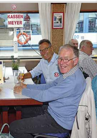
Urkunde für 50jährige Mitgliedschaft