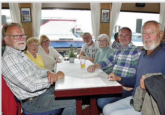
Der gesellige Austausch steht bei der jährlichen Barkassenfahrt im Vordergrund